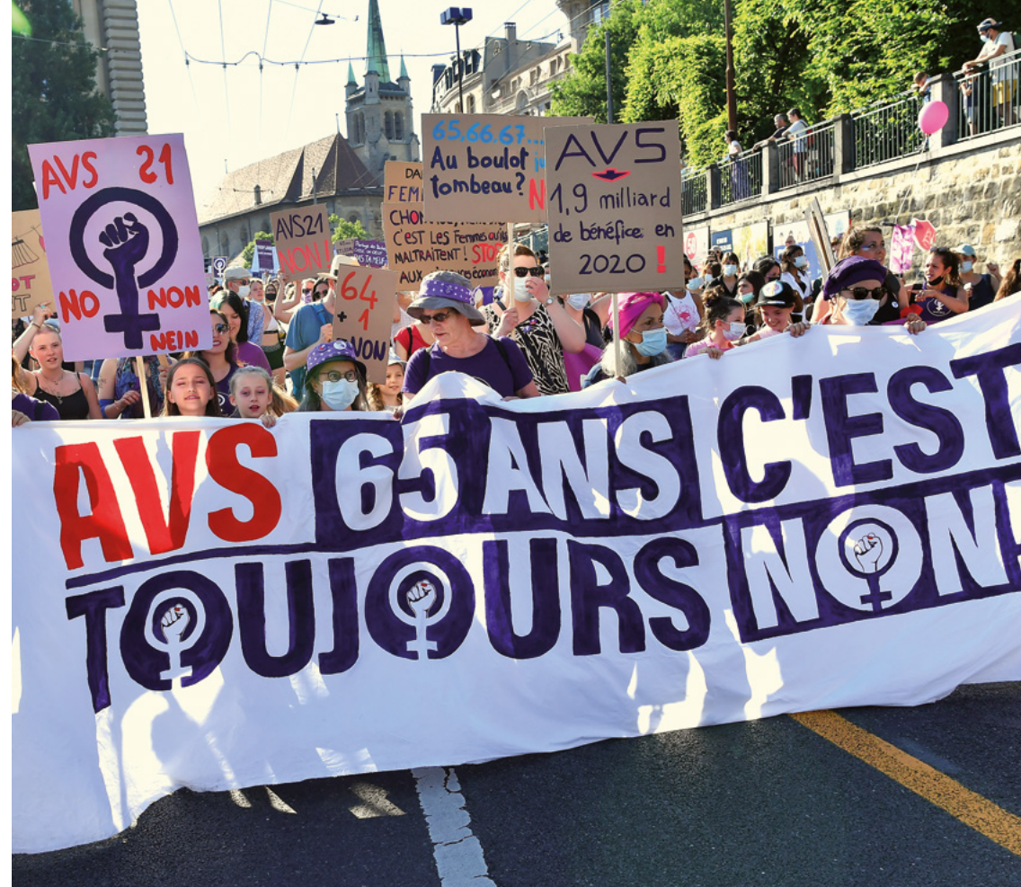
graphisme: charlottedesign.ch

18 septembre: manifestation nationale à Berne